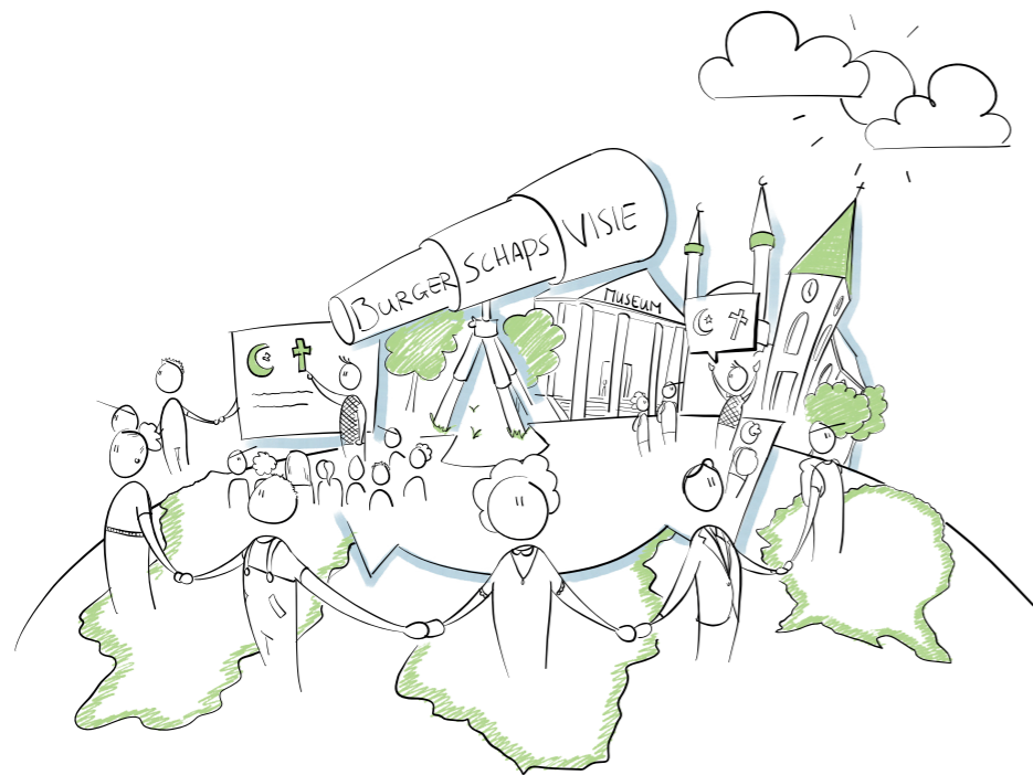
De school heeft een visie op burgerschap en staat hiermee midden in de maatschappij.