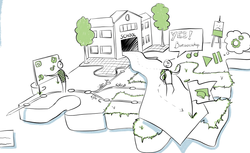
Het is duidelijk wat de student moet doorlopen voor burgerschapsonderwijs